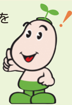
国保マスコット 健康まるくん

健診結果表がないと申請できません。 3月末までに申請するために、 2月頃までの受診をおすすめします。