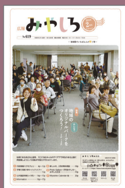
地域のオリジナルパーク をつくらう!