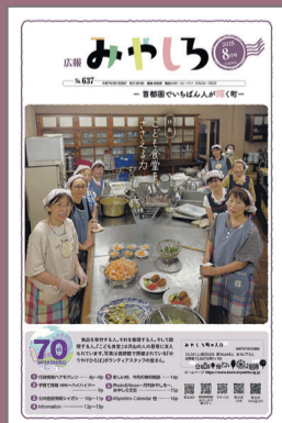
地域みんなで子ども たちの居場所づくり事業