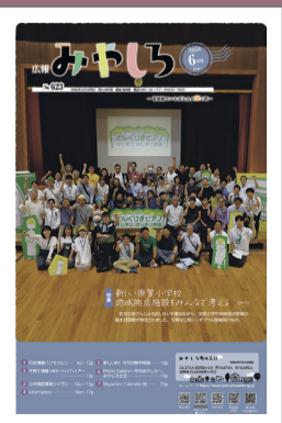
宮代町立小中学校 適正配置事業

後期実行計画事業については進ちょくにあわせて、広報みやしろで紹介していきます。下写真は前期実行計画事業(令和3年度~7年度)の取り組みを紹介した特集記事