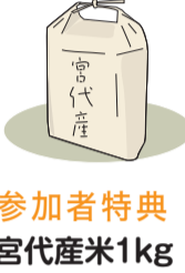
参加者特典 宮代産米1kg

暑くて外に出られず、ゲーム・動画三昧になっていませんか?室内で運動をして親子で楽しい時間を過ごしましょう。 日時 7月29日(水)9時30分~11時(受付9時15分~) 場所 進修館 大ホール 対象 町内在住の年長~小学3年生と保護者 定員 20組(先着順) 内容 親子で楽しむ運動、親子でかけっこ(足が速くなるポイントを教えます)、みんなでおいごっこ 費用 無料 持物 動きやすい服装、飲料、タオル※お子様は、ひざが出るズボンでお願いします ※保護者の方も一緒に運動を行います 託児 1歳~小学6年生までの8名(先着順) 申込 7月15日(水)までに 町公式LINE