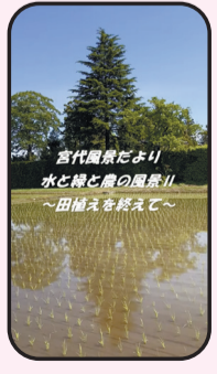
宮代風景だより 水と緑と農の風景Ⅱ〜田植えを終えて〜 終えて〜▶特派員 山本豊