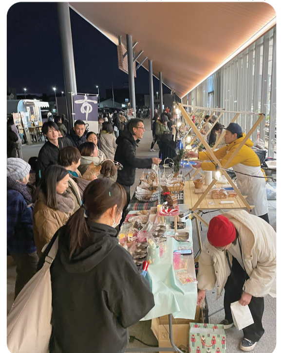
▼クリスマスマーケット

東武動物公園駅西口エリアを、人が集まりにぎわいを創出するような場所にするための仕掛けづくりを行います。