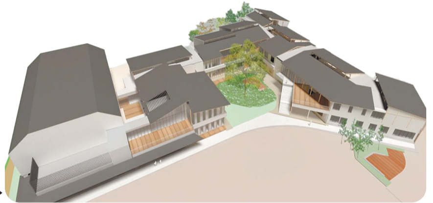
新施設イメージ図▶

7月から旧校舎の一部解体、10月には新施設の建設工事に着手します。令和10年度中の開校を目指します。