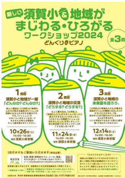
須賀小&地域がまじわる・ひろがるワークショップ2024

今後も引き続き、ワールドカフェやワークショップなど参加しやすい市民参加手法を積極的に取り入れることにより、多世代の町への関心や参加意欲を掘り起こし、審議会等への参加につなげるなど、市民参加の裾野を広げていく取り組みを推進します。