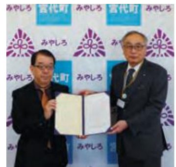
宮代町上下水道事業審議会による答申の様子