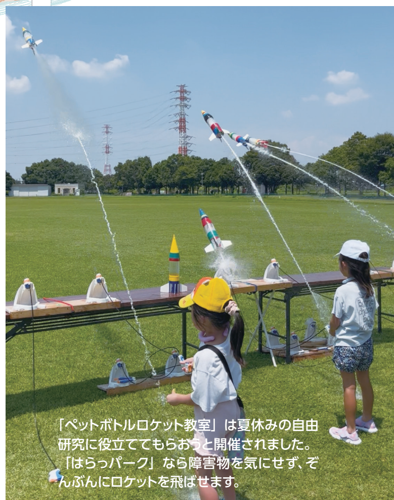
「ペットボトルロケット教室」は夏休みの自由研究に役立ててもらおうと開催されました。「はらっパーク」なら障害物を気にせず、ぞんぶんにロケットを飛ばせます。