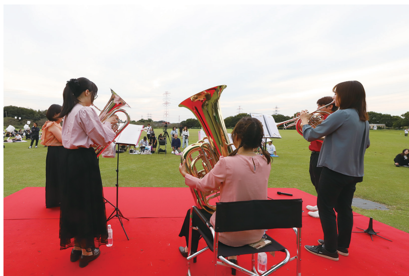
「スカイランタンinみやしろまち」は午後3時に開会。ステージイベントが行われ、軽快な音楽が広場に鳴りひびきます。

町商工会青年部は、ここを使って10月12日に「スカイランタンinみやしろまち」を開催しました。参加者が願いや想いを書いたランタンを夜空に浮かべます。昨年に続いてのイベントには