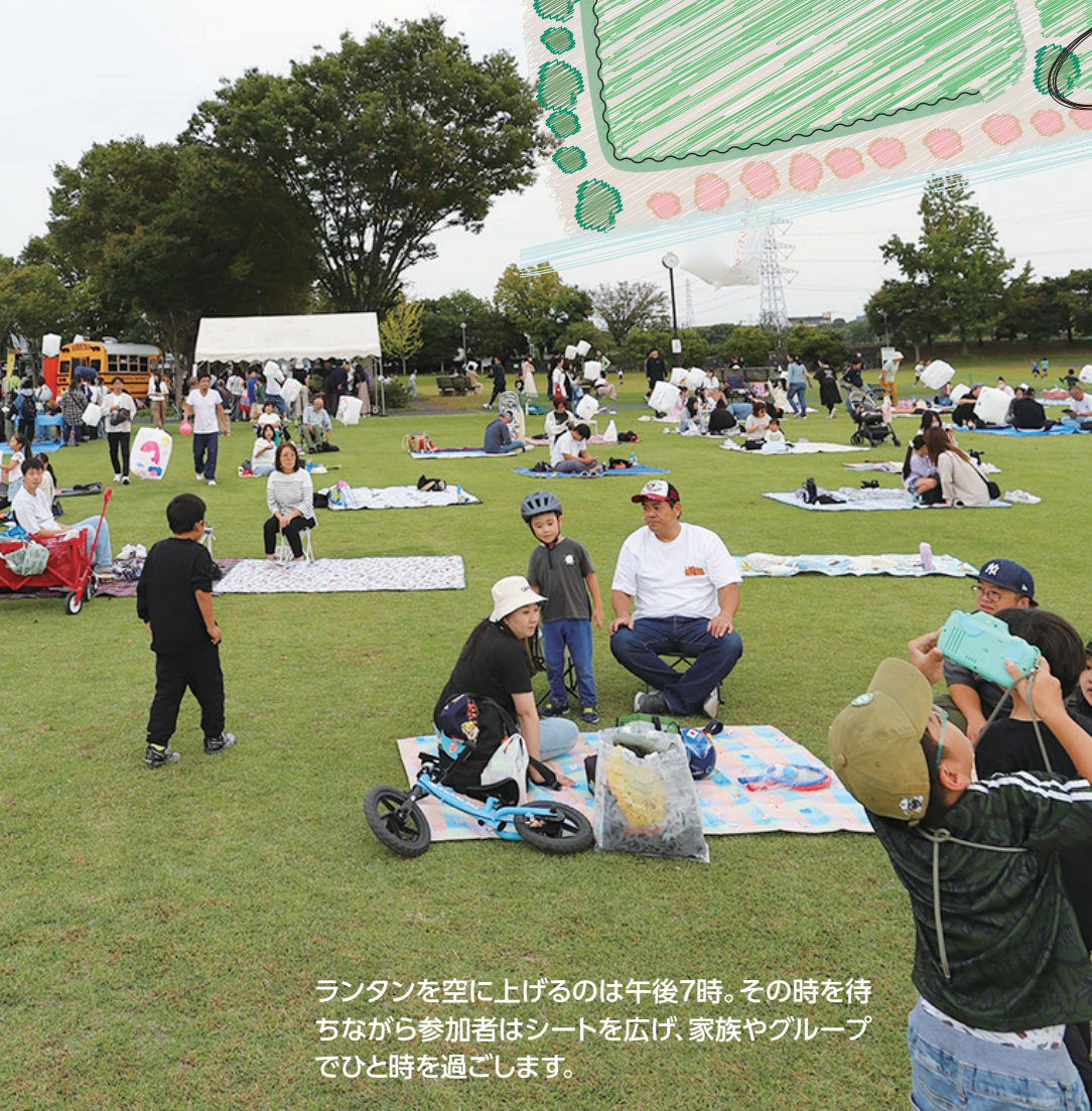
ランタンを空に上げるのは午後7時。その時を待ちながら参加者はシートを広げ、家族やグループでひと時を過ごします。