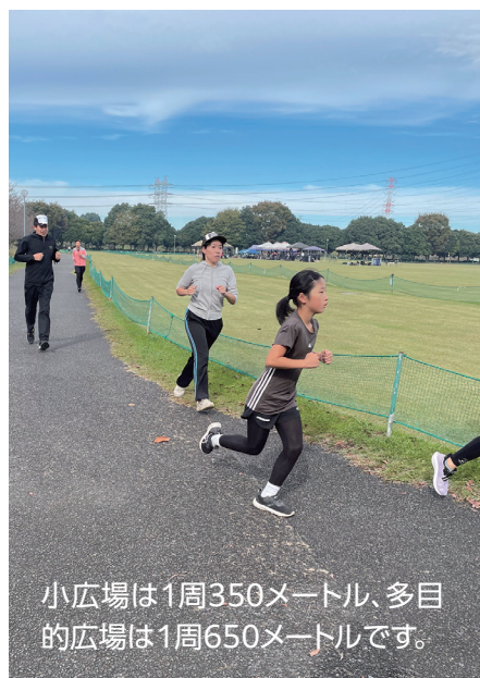
小広場は1周350メートル、多目的広場は1周650メートルです。