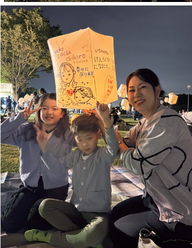
集まった参加者の皆さんは願いや想いをランタンに書きました。