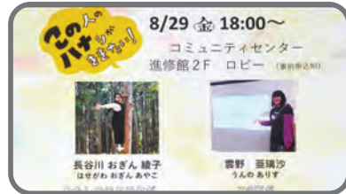
この人のハナシがききたい ▶特派員 野村啓二