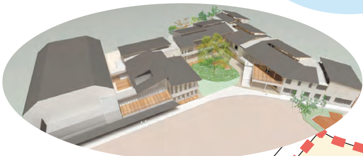
完成イメージパース図

令和10年度オープンに向けて 須賀小学校地域拠点施設については、令和4年から無作為にお声がけした町民の皆さんや関係者によるワークショップを繰り返し、構想や計画を策定してきました。令和10年度のオープンに向けた今後のスケジュールをお知らせします。