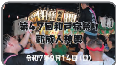
第47回和戸宿祭り新成人神輿編 ▶特派員 諸星秀壽、根岸重之、小島秀男