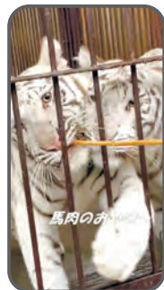
ホワイトタイガー チビとら part21 ▶特派員 山本豊