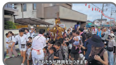
第47回和戸宿祭りイベント編 ▶特派員 諸星秀壽、根岸重之、小島秀男