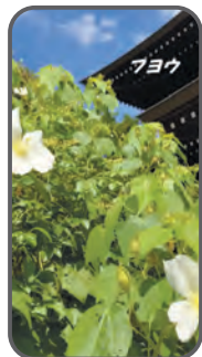
宮代花だより:初秋 の花風景 ▶特派員 山本豊