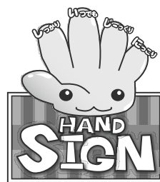
道路横断時の安全行動イメージキャラクター 「サイン(SIGN)ちゃん」