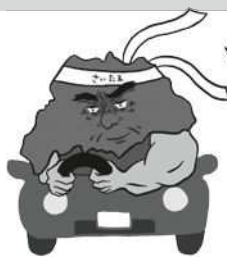
歩行者優先イメージキャラクター 「さいたまお父さん」