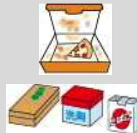
匂いや汚れのついた紙