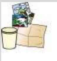
防水加工紙 (紙コップ、写真、アルミ付など)