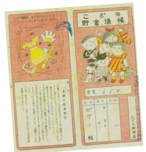
▲「ピアノ様」と書かれた当時の預金通帳。子どもたちが積み立てた貴重な記録です。