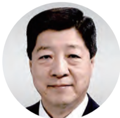
丸藤 栄一 72歳 中島 日本共産党 現