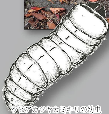
クビアカツヤカミキリの幼虫