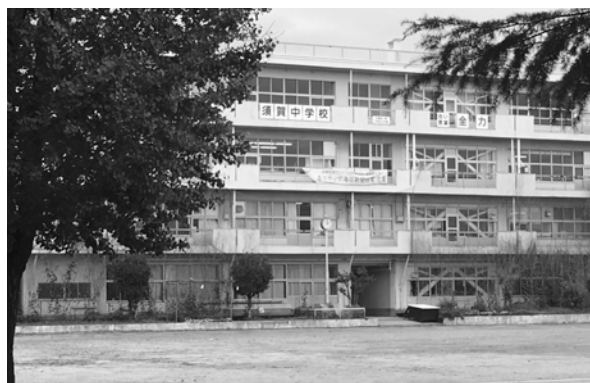
人口の安定している地域から教育環境を進める