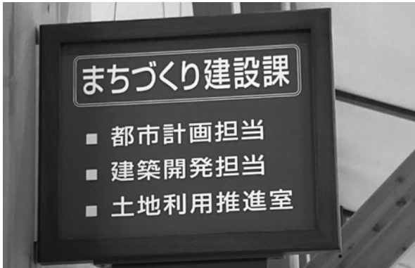
まちづくり建設課内に土地利用推進室を設置