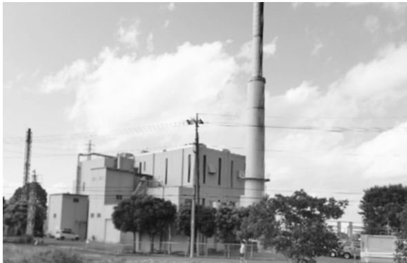
令和9年に解体予定の久喜宮代清掃センター