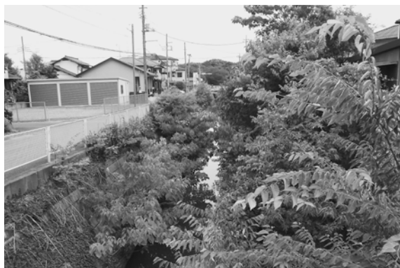
樹木などが生い茂り大雨時に危険な状況の笠原落とし

問 姫宮駅東口付近からの笠原落としは樹木などが生い茂り、川面さえ見えない危険な状況である。町の対応は。