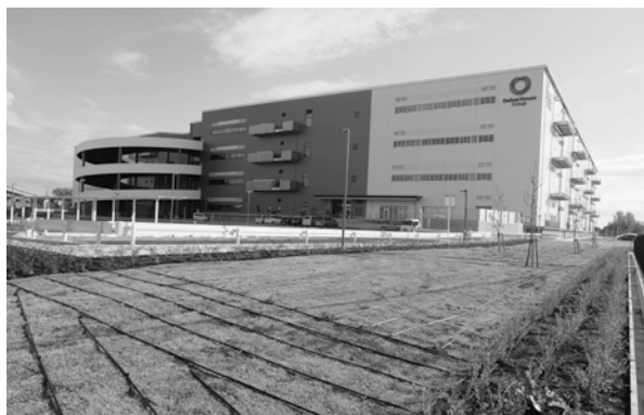
町たばこ税並みの税収確保が見込まれる物流倉庫