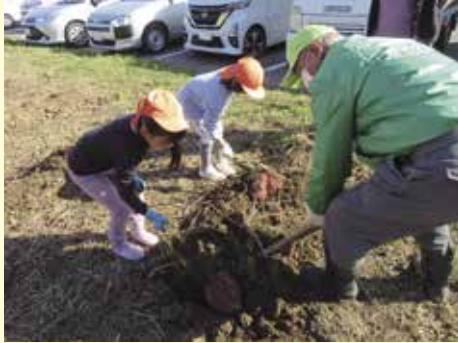
秋の恒例子どもたちとの芋掘り会

A 2004年にライオンズクラブやロータリークラブが解散したのをきっかけに新たに、地域貢献のため立ち上げた団体です。現在16名の会員やふれんだむの方々と一緒に月2回活動しています。