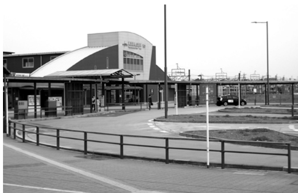
今後が期待される、東武動物公園駅西口