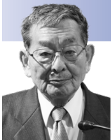
にしむら しげひさ 議員 西村 茂久