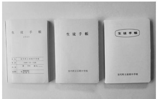
制服の選択制に伴う変更は来年度生徒手帳にも記載