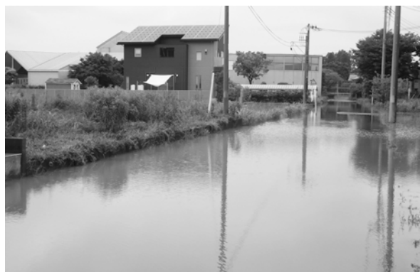
台風2号による図書館入口付近の道路冠水（6月3日）

また、施設関係者との間で受入れの準備や訓練についても計画づくりとともに進めていく必要がある。