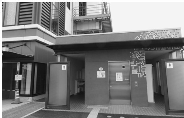
3月に設置され、市民から喜ばれている幸手駅のトイレ

問 他の自治体では主要駅や公園などにトイレを設置している。東武動物公園駅だけではない。宮代町も24時間使用できるトイレの設置を。