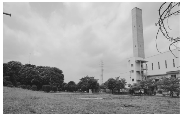
新ごみ処理施設建設予定地（苜蒲清掃センター周辺）