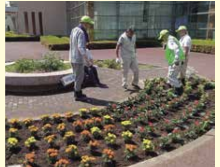
年に2回の花壇の植え替え(庁舎前)