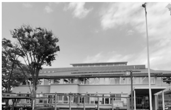
脱炭素に向けて宮代町の進む道は

問 「ゼロカーボンシティ」宣言をし、具体的取組が期待される。再エネ設備導入の取組は。