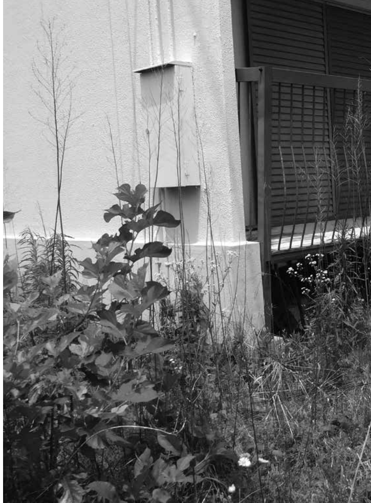
町内には空家が増えてきました