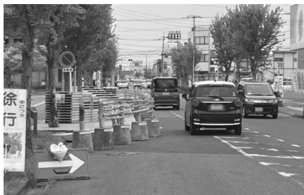
「こんなことに税金を使ってほしくない」と批判の声も

問 役場前道路に作った工物の総費用は。 答 まちづくり建設課長 構想策定業務委託に約480万円、デッキの設置・撤去など約73万円、合計約553万円。 問 怪文書事件の対応は 答 4月の県議会議員選挙で中傷文書がまかれたと、前県議が宮代町議員2名について杉戸警察署に告訴状を提出した。町