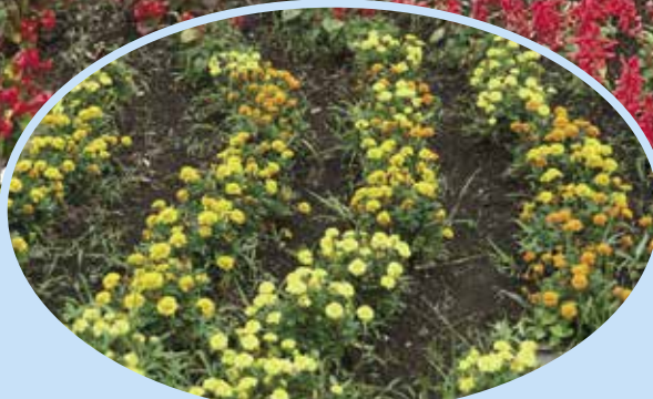
お花でまちを明るく (役場玄関中庭)