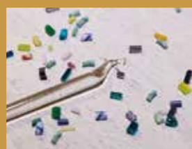
つかむら ござう作品