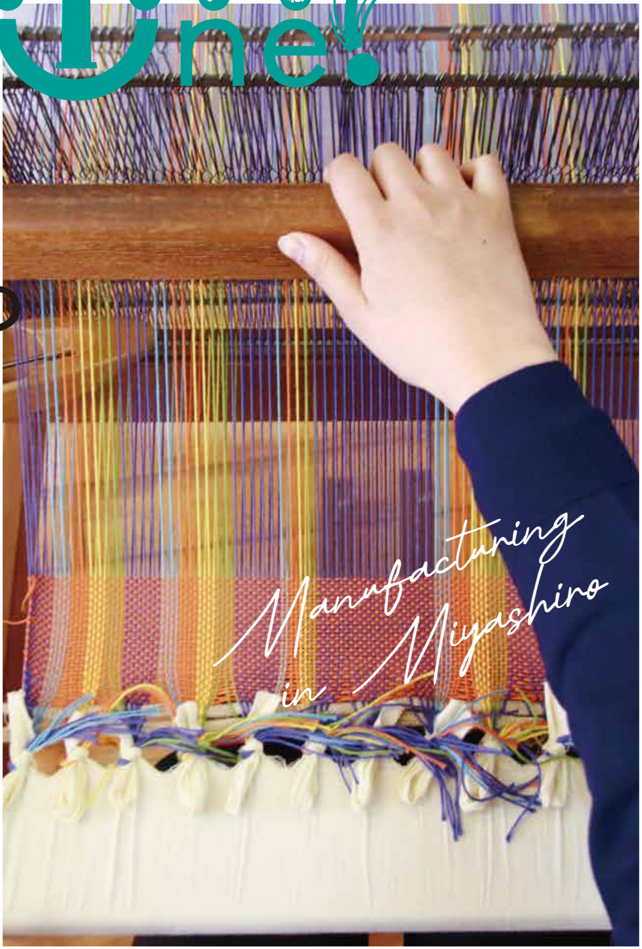
さをり織り(陽だまりサロン)