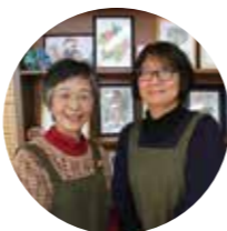
陽だまりサロンスタッフ

仕事や子育て、介護などで疲れやストレスが溜まったとき、無心に織っていると気分転換になります。もちろん、ただ織ってみたい方も大歓迎。畳のスペースがあるので、体験の間にお子さまを遊ばせておくこともできます。