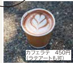
カフェラテ 450円 (ラテアートも可)