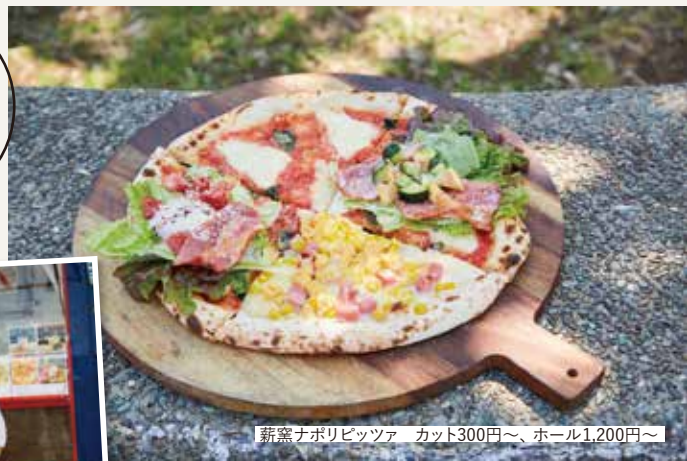
薪窯ナポリピッツァ カット300円〜、ホール1,200円〜