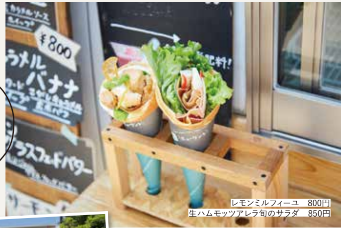
レモンミルクフィユ 800円 生ハムモッツアレラ旬のサラダ 850円