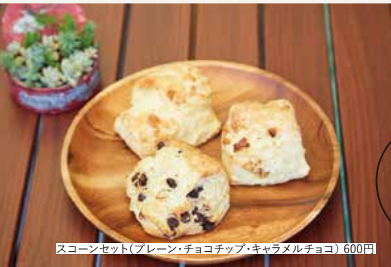
スコーンセット(プレーン・チョコチップ・キャラメルチョコ) 600円