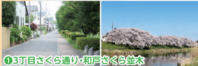
①3丁目さくら通り・和戸さくら並木

和戸地区以外の方たちにも、和戸3丁目地区の桜並木と認識してもらえるように地名を付けました。