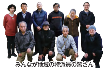
みんなが地域の特派員の皆さん