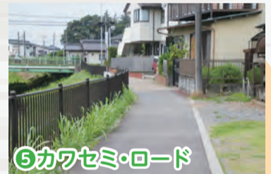
⑤カワセミ・ロード