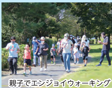
親子でエンジョイウォーキング

「お家でFit! 運動オンデマンドレッスン」に157名が受講し、在宅での運動による健康づくりに取り組みました。アンケートから受講者の取組状況や要望等、課題を把握しました。また、「親子でエンジョイウォーキング」を開催し、働き世代の運動習慣の形成を促しました。