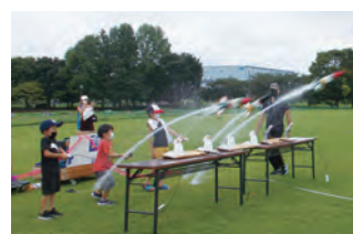
はらっパーク宮代 ペットボトルロケット教室

モニタリングの結果、全ての施設において適正な管理・運営が確認できました。各施設の評価・改善事項等の詳細は町ホームページをご覧ください。