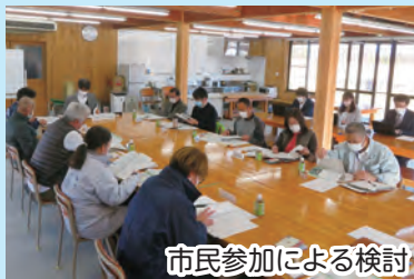
市民参加による検討

「新しい村魅力アッププラン検討委員会」を開催し、上期から引き続き、魅力アッププラン(案)やPR戦略について市民参加による検討を行いました。また、プラン(案)に対するパブリックコメントを行い、計画を策定しました。