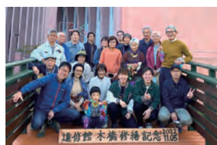
進修館 オープンカレッジ事業 木橋をみんなで修繕しよう!