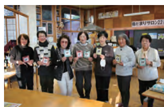
陽だまりサロン 干支のミニ額づくり