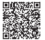
郵送サービスの申込▶

新聞を購読していない世帯で希望される方を対象に、 1世帯1部に限り 選挙公報を郵送します。希望される方は、電話または、下記の申込用QRコードからお申し込みください。今回お申し込みされた世帯には、次回以降の選挙の際も継続して郵送します。