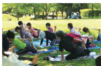
ぐるる宮代 パークヨガスクール