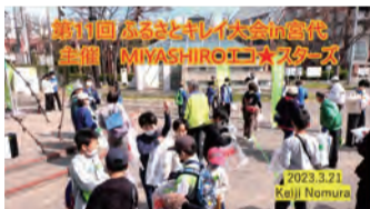
第11回ふるさとキレイ大会in宮代 ▶特派員 野村啓二