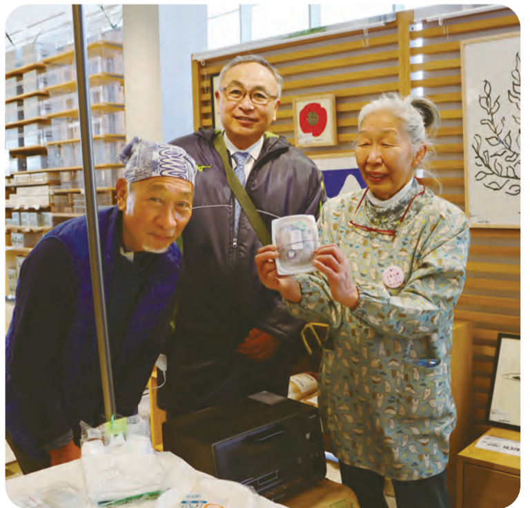
「ミヤシロまるまるマルシェ」ではメイドインみやしろ推奨品の販売も行われました。関連記事15P

147万円 子育て支援課 妊娠中や0歳児のお子さんがある保護者が、ベビーシッター等の育児・家事支援サービスを利用した場合に、費用の一部を助成します。保護者の休養やリフレッシュなど、特に身体的、精神的な負担が大きい産前産後期のサポートを行うことで、子育てを行っている皆さんを応援します。