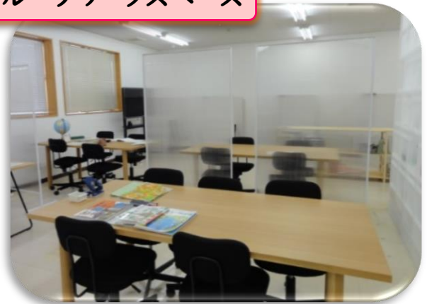
グループワークスペース