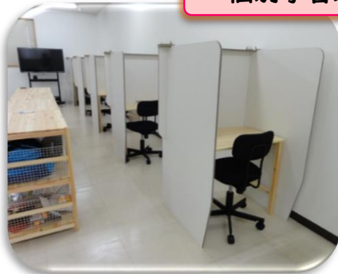
個別学習スペース