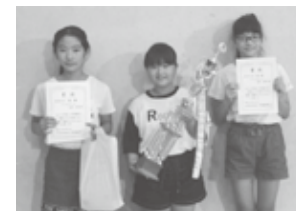
▲高学年の部 優勝 ベリーズレディーズ

今回は、高学年の部の優勝チームのベリーズレディーズに取材をしました。ベリーズレディーズは初参加の児童のいるチームで、昨年は決勝トーナメントに進むことができなかったそうです。