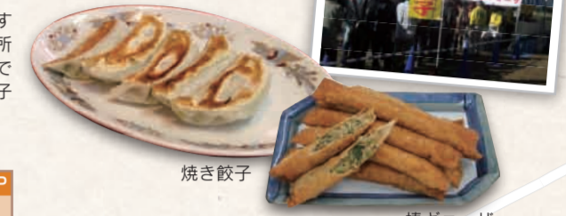
焼き餃子 棒千ヨーサ