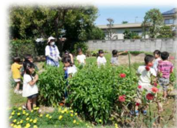
育てたピーマンを収穫して大喜びの園児たち！