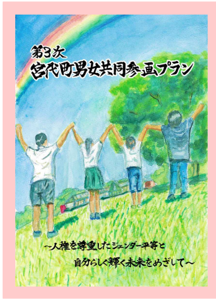
第3次男女共同参画プランはこちらから↓

宮代町では、「第2次男女共同参画プラン」による取り組みを踏まえ、これまでの施策の成果を継承しつつ、プランの進捗状況や住民意識調査の結果、委員会での意見等を反映するとともに、新たな課題を解決するための施策や関連する法律、社会状況等に沿った施策を総合的かつ計画的に推進するため『第3次男女共同参画プラン』を策定しました。男女共同参画社会の実現を目指し、取り組んでいきます。