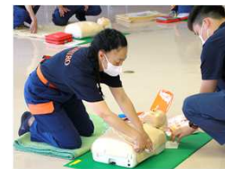
女性消防団の活動

子どもが小さいうちの社会活動への参加は、大変なこともあるし勇気のいることです。私が自然と関わることができたのは、すべてが心優しい方々との出会いによるもので、その「出合い」にとても感謝しています。地域社会に参加することで、様々な人との関わりを持つことができました。考えを共有したり、今しかできない経験をしたりしながら、微力ではありますが貢献できることに魅力を感じています。子どもたちが成長する地元宮代町のさらなる発展を願い、今後も自分にお手伝いできることは参加させていただきたいと思っています。