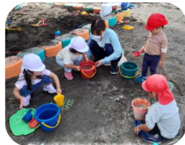
天気の良い日は先生と一緒に砂場で遊びます

姫宮保育園は、保育をする環境が十分に整っているように感じます。園自慢の広い園庭では、毎日子どもたちが元気に走り回っています。製作に使用する保育材料も多数準備されていて、恵まれた環境のなかで子どもたちを保育することができます。また、職員の働き方として、有休休暇を取得しやすくするためにフリーの職員を配置したり、時間単位の有休を導入したり、職員が働く上での環境も整備されています。