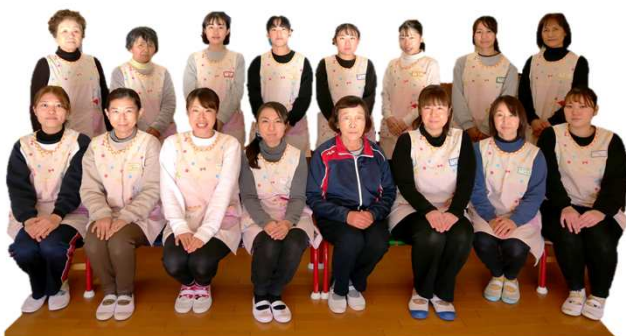
百間保育園の職員のみなさん

ベテランの先生も、新人の先生も何でも相談し合える仲の良い職場です。「家庭を持ちながら好きな仕事を続けている先輩たちをみて、私も頑張ろうと思いました。悩んだ時期もありましたが、みんなが相談に乗ってくれ支えてくれました。相談したり、笑い合ったりできる仲間がいることは、何よりも心強いことです。」と語るのは、子育てがひと段落したA先生。園としても仕事と家庭を両立したいと思う気持ちにこれからも寄り添っていきます。