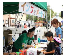
マルシェで大活躍！