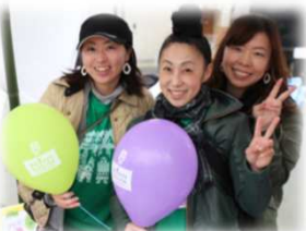
ママさんサポーターと楽しく活動

友人に誘われたことがきっかけで、マルシェ実行委員に興味を持ちました。子育て中のママでも「できる時間だけできることを！」と活動してきました。具体的には会議への参加ですが、難しい時には、他にできることとして、イベントのポスター等を子どもと一緒に町内外のお店に配りに行きました。自分が無理なくできる形で、子どもと一緒にイベントに関われることに喜びを感じながら活動できたと思います。また、友人と一緒に活動できたことで、子育ての悩みを共有したり、ストレスを発散したりすることができ、私にとってその時間はとても大切な時間となりました。