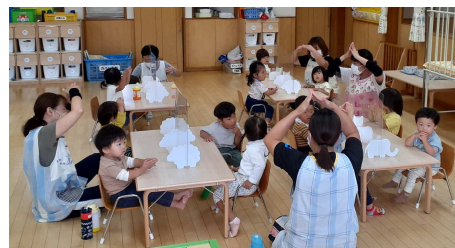
元気いっぱいの園児と職員のみなさん