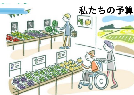
快適に利用できる場のイメージ

新しい村魅力アッププランに基づき、直売所機能やアグリ機能、観光機能等を維持・強化するための概略設計を実施し、新しい村のリニューアルに向けた取り組みを進めます。