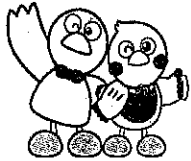
埼玉県マスコット コバトン さいたまっち