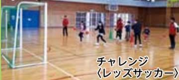
チャレンジ (レッズサッカー)