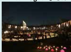
「へび棒のフレンズ」さん