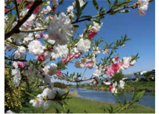
大落古利根川沿の八重桜