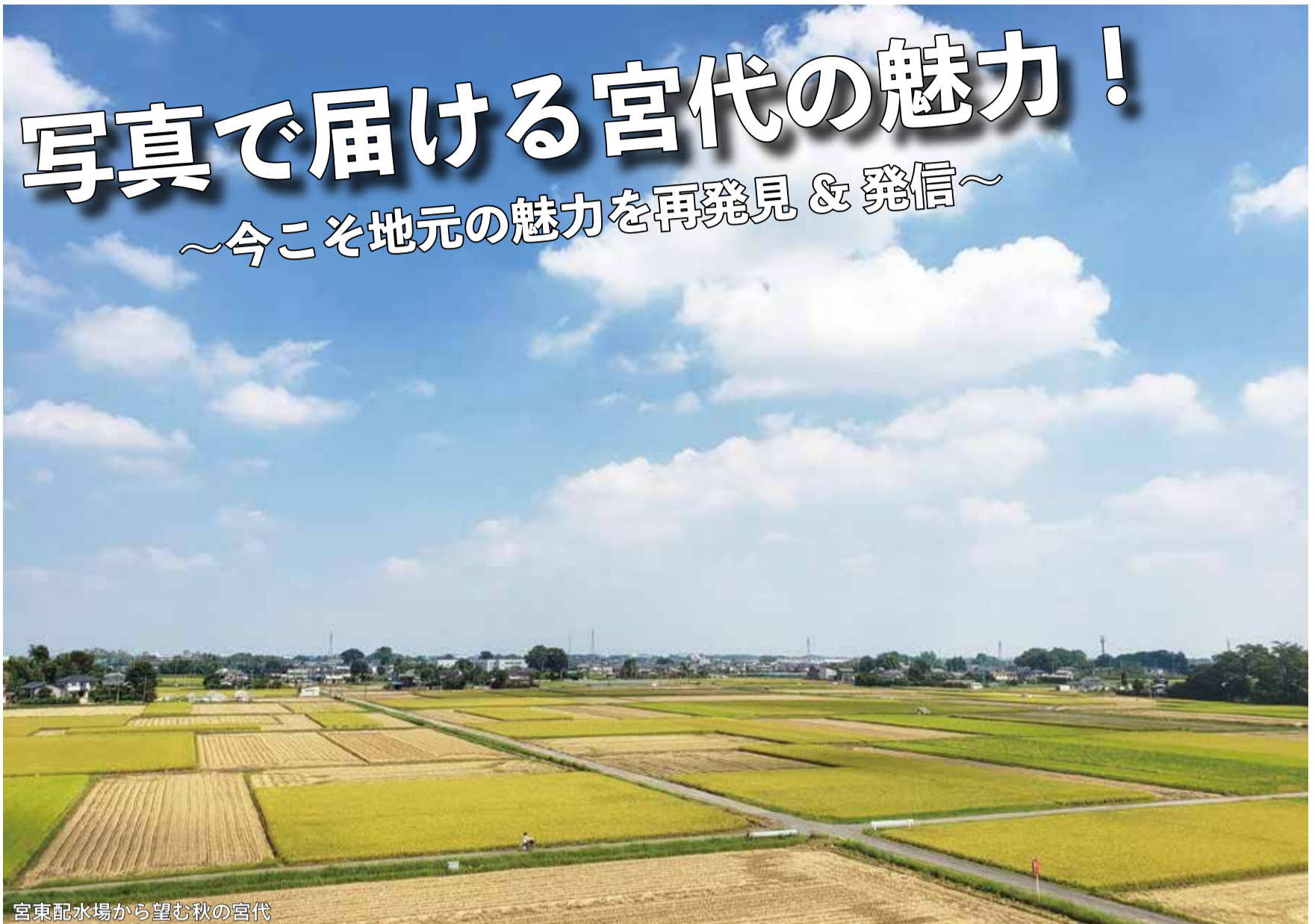
宮東配水場から望む秋の宮代