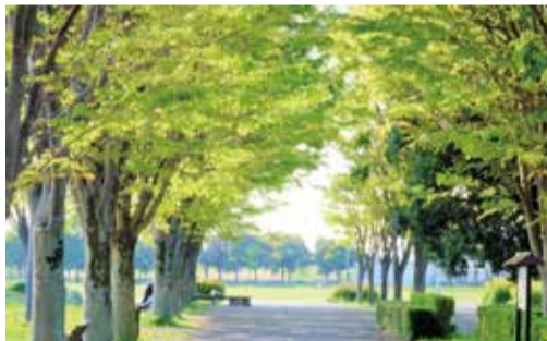
はらっパーク宮代の並木道