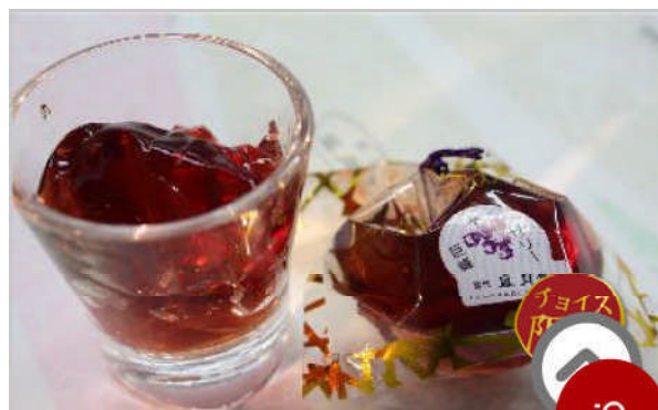
巨峰ゼリーセット(10個入り)