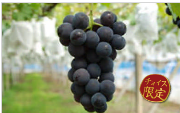
みやしろ特産・巨峰(3kg)セット