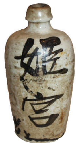
リターナブル瓶の先駆・通い徳利

この企画展は10月20日(日)までの開催です。期間中の休館日は、9月2・9・17・24・30日、10月1～4・7・15日となっています。皆様のお越しをお待ちしています。