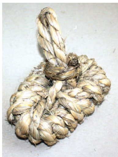
藁 (わら) で作られたタワシ

今回の企画展では、収蔵品展としてみなさまから寄贈・寄託していただいた資料の中から、特に稲ワラを使って作られた道具類や、衣類などの身近な資料を中心に紹介しています。