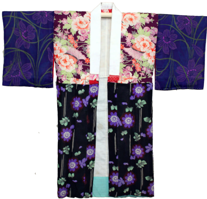
3種類以上の布から作られた襦袢