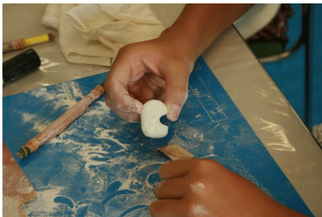
まがたまの形が出来上がってきました

「夏休みとっておき体験」では、小学校1年生以上を対象とした縄文ペンダントづくり(2回)、しほり染め体験(初級)(2回)、昔の帳面づくり、小学校4年生以上を対象としたまがたまづくり(2回)、はんこづくり(2回)を実施しました。