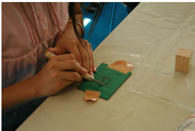
彫刻刀を上手に使って彫っていますね

縄文ペンダントづくりやまがたまづくりでは、石を自分で書いた形の通り削ったり磨く作業がなかなか大変だったようですが、首にかけるひもを通す穴が開いた瞬間の笑顔が素敵でした。出来上がったペンダントやまがたまを、さっそく首にかけてとてもうれしそうでした。