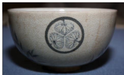
葵の紋入り粟田口焼の茶碗