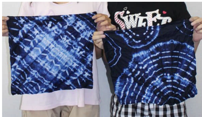
すばらしいしほり染めのハンカチが出来ました

昔の帳面は、紙をそろえ紐を通し、昔ながらの帳面をつくりました。「学習帳に使うんだー」という子どもたちもいました。