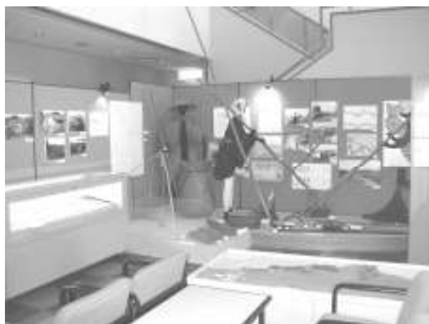
展示風景(笠原沼田んぼの暮らし)