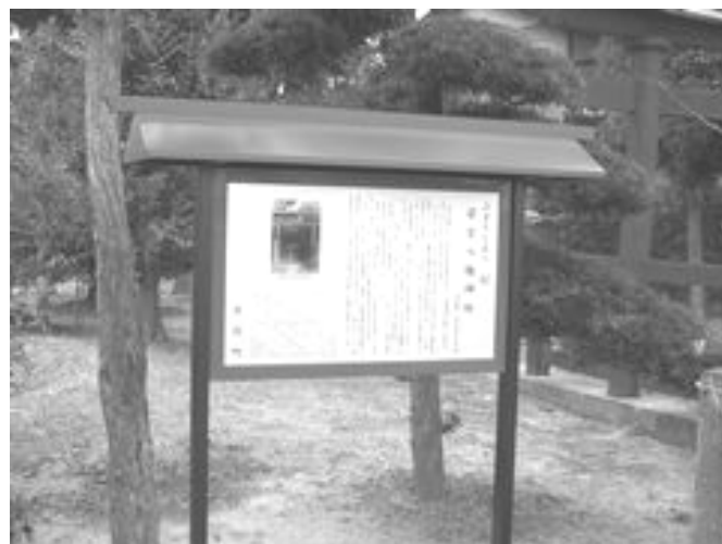
若宮八幡神社の案内板

※ 現在設置されているところについては、前ページに地図を掲載いたしましたので参考にしてください。