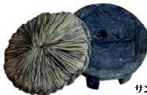
サンダワラ編みと サンダワラ