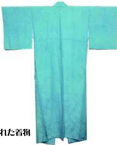
染め替えされた着物