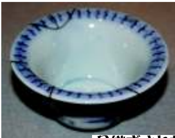
金継ぎされた湯呑

大量生産・大量消費の現在は、直すよりも新品を購入した方が安価な場合が多いですが、昔はなんでも貴重だったので、傷んだり壊れたりしてしまっても、まずは直すことを考えました。修理は専門の職人に依頼するほかに、自分でもできる限り行ないました。資料として残されたモノの中には、修理の痕を見ることのできるものがありますが、その出来映えや方法などには思わず感心してしまいそうです。