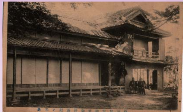
鷲宮神社御神湯殿ノ光景