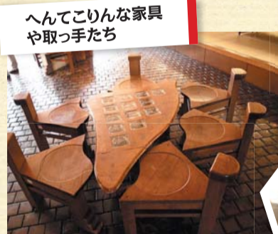
へんてこりんな家具や取っ手たち

館内には、面白い家具などがあちこちに点在。いろんなところに隠れているから探してみよう。