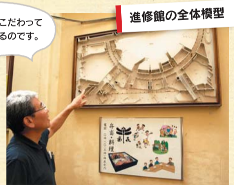
進修館の全体模型