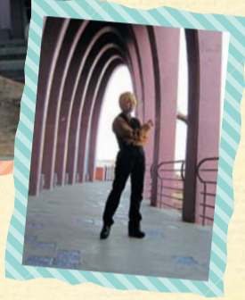
※写真の無断撮影は禁止されています。