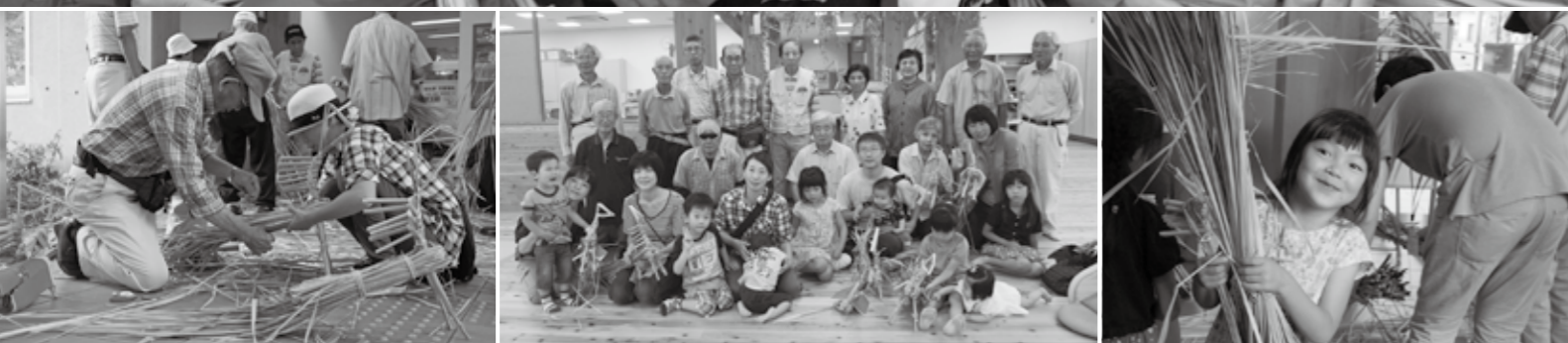
●まこも馬に子どもの幸せのせてかざろう (6月27日 オープンした子育て広場)