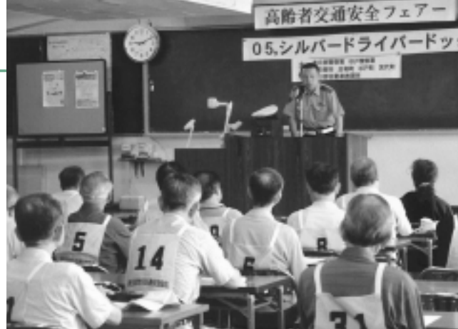
高齢者のための安全教室