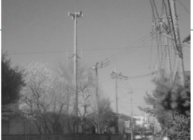
防災行政無線聞こえるように増設を

4月に改定される、介護保険「新予防給付」について (問) 要支援2の判定基準は。町の判定割合予測は。 (答) 町の判定割合予測は。要支援2と判定された場合、自分の受けている介護サービスが低下するのではと