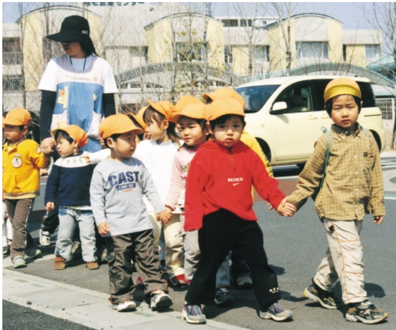
みんな くるまに きをつけてね!