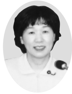
角野 由紀子 議員 (公明党)