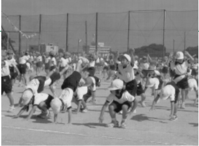
安心・安全な環境を子どもたちへ