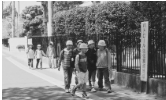
地域での防犯への取り組み

Q 町民の責務として、自らの安全を守るための措置とは。 A 例えば、地域での防犯パトロールは、犯罪を起させない地域づくりにつながる。 具体的なことについては、今後、計画をつくる中で提案がなされると考える。