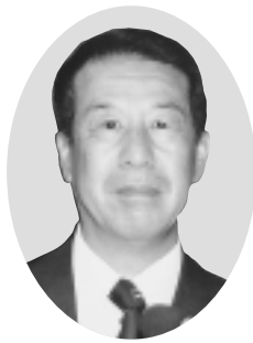
榎本和男 議員 (清風会)

駅前整備を進めるものである。杉戸工場の機能移転に伴い、跡地とその周辺部の区画整理と、接続する都市計画道路動物公園駅西口通り線などを一体的に整備を行うための調整測量を平成16年度までに完了した。 その後は、平成17年度末、東武として駅西口地区の整備について、社内で検討している旨の情報を得た。工場跡地を含めた駅西口地区の整備に向け、東武鉄道と緊密な連携を図っていく。