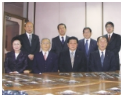
編集委員会の新メンバー

世の中の変化は著しいも のがありますが、自然は変 わることなく、今年も花の 便りを運んできてくれてい ます。 今年の「桜市」は、例年 とは趣を変えロングランで 開催され、夜桜も多くの人 出で賑わい、宮代の春に彩 りを添えてくれました。新 年度を迎え、議会だよりは新 メンバーでの発行となり ます。春のような爽やかな 記事をお届けできるよう努 力してまいります。