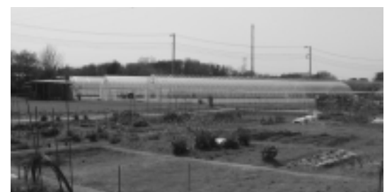
新しい村 育苗ハウス

Q 町の広報がどこまで読まれているか。 A 情報提供のあり方を検証する中で、聞き取り調査をはじめ実態把握に努める。 Q 自治会未加入世帯への広報配布は。 A 約1600世帯に配布されていない。町内約50カ所に広報誌を用意している。 Q 町ホームページのアクセス件数は。 A 約1600世帯に配布されている。