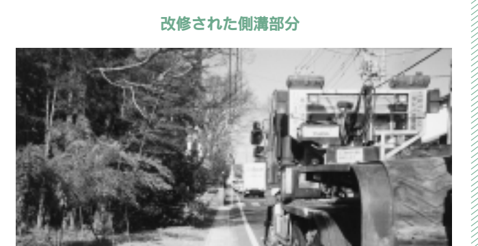
改修された側溝部分

工事に関する計画は現在のと ころないようだ。 また、町の対応ということ だが、当面の課題であった和 戸交差点から踏切までの道路 側溝段差解消およびふたかけ について、今年度施工してい ることから、今後とも杉戸県 土整備事務所と連携を図りな がら、安全性の確保に努めて いきたい。 道路には県で管理している 部分、町で管理している部分 があり、互いに調整しながら 整備を進める必要がある。