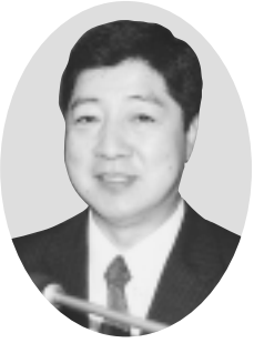
丸藤 栄一 議員 (日本共産党)