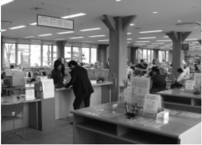
住民の目線にたった対応を

(問) 今回の焼却炉の改修工事については不透明なまま進められているが、大規模改修の必要性と改修計画に至った経過は。 (答) 町民生活課長 現在の焼却炉は建設から26年と31年