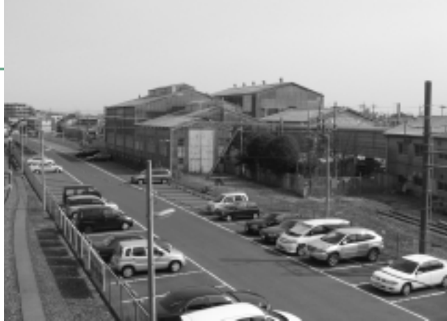
東武工場跡地の開発を急げ