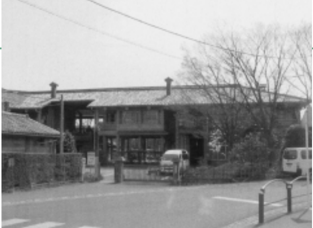
皆さんどう思いますか